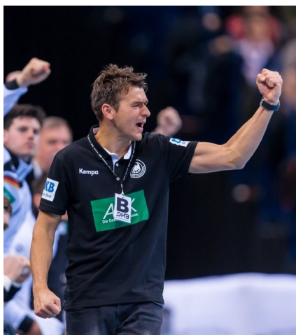
Gelungener Auftakt für Bundestrainer Christian Prokop

Nachdem der WM-Dritte Slowenien am Mittwoch sein Heimspiel überraschend deutlich mit 23:32 gegen das Team von Bundestrainer Christian Prokop verloren hat, kommt es am Samstag im Gerry Weber Stadion in Halle/Westf. zum Rückspiel in der EM-Qualifikation. Um 16.10 Uhr wollen die Bad Boys mit einem weiteren Sieg vor heimischer Kulisse die vorzeitige Qualifikation für die EM 2018 in Kroatien schaffen. Deutschland als Gruppenerster hat sich eine hervorragende Ausgangssituation geschaffen und hofft nun mit der Unterstützung des Publikums auf eine weiteres Handball-Highlight in Westfalen.