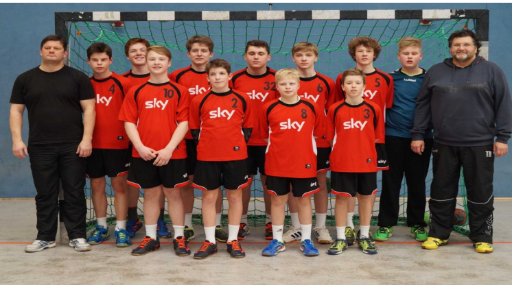
Kreisauswahlmannschaft vom HK Minden-Lübbecke

Mitte November konnten sich bei den Jungen HK Minden-Lübbecke, HK Lippe, HK Münster, HK Hellweg, HK Dortmund und HK Iserlohn-Arnsberg in die stärkere Gruppe kämpfen. Ohne Niederlage konnten sich die Jungs vom HK Minden-Lübbecke auf den ersten Platz kämpfen. Die Handballkreise Münster, Hellweg und Iserlohn-Arnsberg machten es spannend, denn sie hatten am Ende des Tages alle 6:4 Punkte. Doch das beste Torverhältnis konnte der HK Münster aufweisen und so stand dieser am Ende auf Platz zwei. In der anderen Gruppe der Jungs kämpften HK Bielefeld-Herford, HK Gütersloh, HK EUREGIO, HK Industrie, HK Hagen/Ennepe Ruhr und HK Lenne-Sieg um den Titel. Am Ende des Tages hatte der HK Gütersloh und der HK Lenne-Sieg 8:2 Punkte. Doch da Gütersloh gegen Lenne-Sieg mit einem Tor gewann konnte sich der Handballkreis Gütersloh mit dem Titel brüsten.